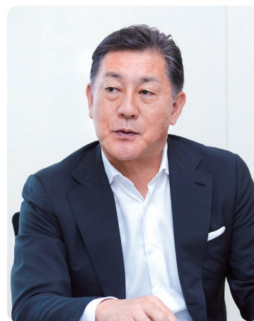
文部科学省 初等中等教育局 主任視学官