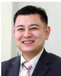
◎解説 VIEW next編集部 高校領域担当責任者 河野仙一

スクール・ポリシー策定の 出発点は、教師同士で 対話を重ねながら、 自校の課題を整理すること